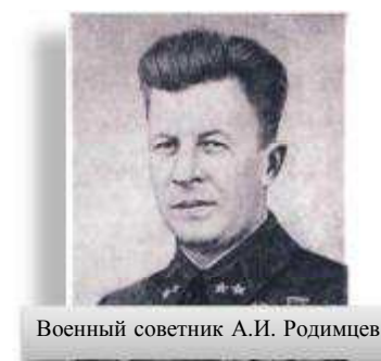
Военный советник А.И. Родимцев

Второй батальон стал готовиться к обороне. Я забрался на четвертый этаж телеграфа и стал устанавливать на подоконнике ручной пулемет. С высоты было видно, как впереди, метрах в шестистах, противник подвозил на грузовиках подкрепление.