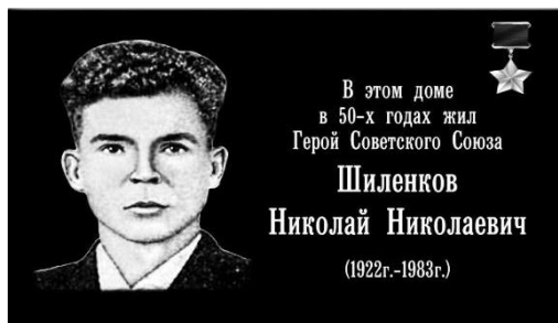
Эскизный проект мемориальной доски Герою Советского Союза Шиленкову Николаю Николаевичу

Совет депутатов городского поселения Наро-Фоминск решил: Установить мемориальную доску Герою Советского Союза Шиленкову Николаю Николаевичу по адресу: г. Наро-Фоминск, пл. Свободы, д.6.