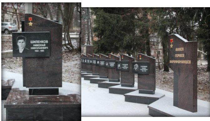
Обелиск Н.Н. Шиленкову на Аллее героев-нарофоминцев на территории мемориального комплекса на улице Калинина.