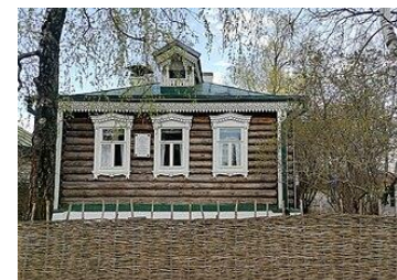
Дом родителей Сергея Есенина

Не в моего ты Бога верила, Россия, родина моя! Ты как колдунья дали мерила, И был как пасынок твой я. Боец забыл отвагу смелую, Пророк одрях и стал слепой. О, дай мне руку охладелую — Идти единою тропой. Пойдем, пойдем, царевна сонная, К веселой вере и одной, Где светит радость испоконная Неопалимой купиной. Не клонь главы на грудь могучую И не пугайся вещим сном. О, будь мне матерью напутною В моем паденье роковом. (из первого сборника «Радуница», 1916 год)